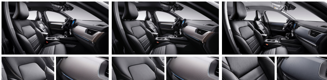
블랙 가죽시트 (Techno, Iconic 선택) 하이드로 핵사곤 데코 (Techno, Iconic) 블랙 헤드라이너 & 골드 스티치 (Techno, Iconic)