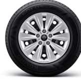
16" 스틸 휠