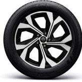
18" 다이나믹 블랙 투톤 알로이 휠