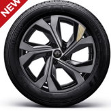
18" 다이나믹 블랙 투톤 딥터드 골드 액센트 알로이 휠