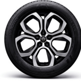
18" 블랙 투톤 알로이 휠