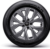
17" 다크 그레이 휠